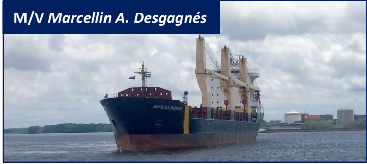
M/V Marcellin A. Desgagnés

21 Marché-Champlain Street Québec, Québec G1K 8Z8 Canada Tel: 418.692.1000 Fax: 418.692.6044 Email: info@desgagnés.com Website: www.desgagnés.com