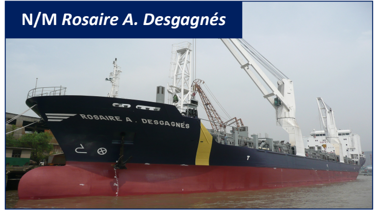
N/M Rosaire A. Desgagnés

21, rue du Marché-Champlain Québec (Québec) G1K 8Z8 Canada Tél. : 418.692.1000 Téléc. : 418.692.6044 Courriel : info@desgagnes.com Site Web : www.desgagnes.com